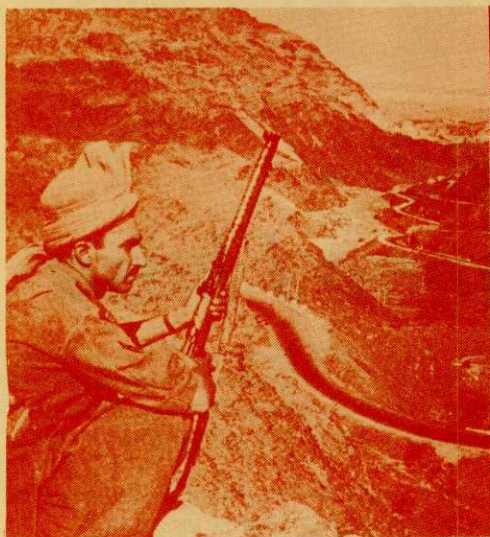
Frigjøring – eller – slaveri!

Hvis du er for den tredje verden mot imperialismen, for «sør» mot «nord», for U-land mot I-land, er Rød Ungdom det eneste alternativet. Å støtte den tredje verden er også å støtte menneskeheten i den rike verden. For intet system kan i lengden bestå ved å undertrykke andre nasjoner og folk.