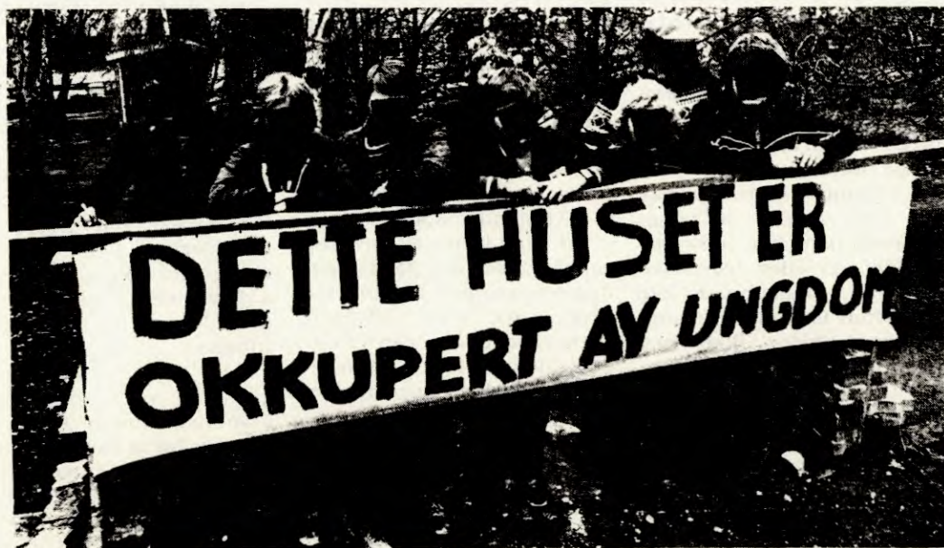
«Skal det oppnås varig framgang i ungdomsarbeidet, må det legges planer for rekruttering og planer for skoling av ungdommen».

dene er sjølsagt å oppdra seg sjøl og utvikle et klart og helstøpt verdenssyn.» Hvis vi har dette klart og sørger for en skikkelig plan og organisering trur jeg sikkert at Rød Ungdom både vil klare å rekruttere folk og skolere dem til å bli kommunister. Men jeg tror samtidig det er viktig at de som leder ungdomsarbeidet ikke venter på supre skoleringshefter og studiesirkler, men analyserer konkret hva det er behov for å studere for akkurat den bestemte ungdommen de jobber sammen med. Jeg vil oppfordre folk til å finne fram småhefter om imperialismen og om historia, bruke noveller og romaner, avisartikler og dikt og sist men ikke minst: de kommunistiske klassikera. Kort sagt: I tillegg til å lære av m-l-bevegelsens historie, er det nødvendig å bruke fantasien og begynne å tenke i nye baner, også når det gjelder skolinga av ungdommen.