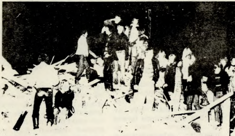
«A la carte» ungdommene i Fredrikstad. (Bildet har ikke noe med det omtalte å gjøre).

TF har prata med en partikamerat som nettopp har vært med i en husokkupasjon. Dette er ikke noen oppsummering av aksjonen, men noen lærdommer og ideer som kan være til nytte for andre.