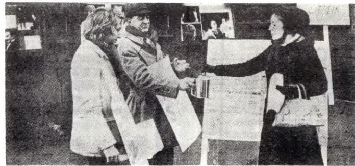
Innsamling til streikende teaterarbeidere i Oslo

støtten kan komme for seint. Når det gjelder sykepleierne, vil jeg gjerne si: Den støtten som til nå er kommet fra arbeidsplassene, representerer mellom 10 og 15 000 fagorganiserte. Hvilken uvurderlig betydning dette har for sykepleierne, i tilfelle streiken skulle bli langvarig, kan ikke understrekes sterkt nok. Å gi offisielt uttrykk for støtte er en alvorlig sak for fagorganiserte. Å slå handa av slik støtte er å sette seg sjøl i fare. La meg nevne et eksempel: På en arbeidsplass på Vestlandet var det umulig å få sammenkalt styret i fagforeninga da vi henvendte oss dit. Men formannen visste rad. Han tok med støtteerklæringen, gikk rundt til hvert enkelt styremedlem på jobben, og fikk vedtak om støtte. Han skjønte alvoret i situasjonen, og lot seg ikke stanse. I det hele tatt: Folk har vært ivrige etter å støtte. Derfor haper jeg at vi kan fortsette vårt støttearbeid. Fordi vi mener at støtte fra dem som har felles interesser med sykepleierne er en forutsetning for at kampen skal vinnes. Og det er vårt eneste ønske.