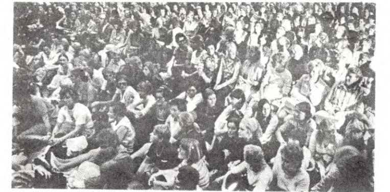
Allmannamøter sikrer demokratiet i streiken

FOR Å VINNE EN STREIK MÅ VI ALLE ARBEIDE