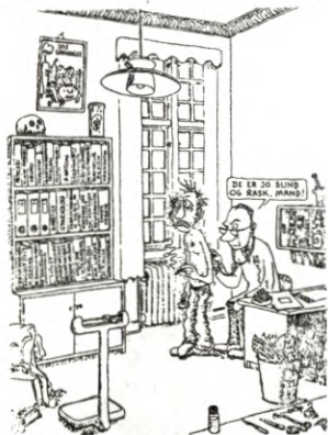
Illustrasjon fra arbeidsmiljøundersøkelsen i Danmark.

DS prøver å lage opplegg for avdelingsmøte om den faglige taktikken, årsmøtene og tariffoppgjøret. På disse møtene vil vi prøve å lage lokale planer. Dette står det mer om annetsteds i FFP.